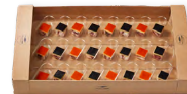
80528 | Pulpo-Oliven-Quader