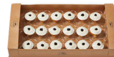
81784 | Heilbutt-Kokos-Würfel