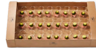
89753 | Rauchmatjes-Gurke-Fenchel