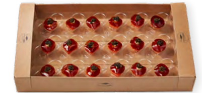
89911 | Lachswürfel-Teriyaki