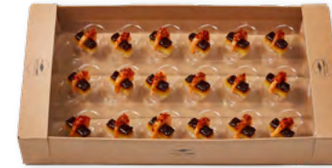
89913 | Rauchgarnele-Gelbe Bete-Karree