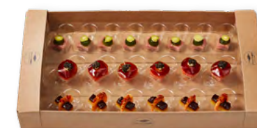
89907 | meerrauch®-Selektion II Rauchtmatjes-Gurke-Fenchel Lachswürfel-Teriyaki Rauchgarnele-Gelbe Bete-Karree