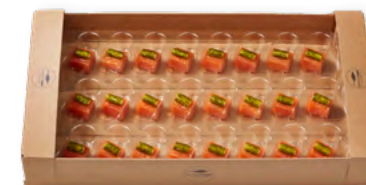
88190 | Lachs-Gurken-Cannelloni