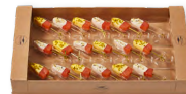
81785 | „Arctic Rose“-Lollis Safran und Zitrone