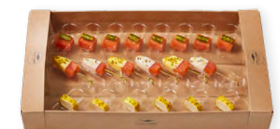
88189 | meerrauch® Best of Lachs-Gurken-Cannelloni „Arctic Rose“-Lollis Safran und Zitrone, Kabeljau-Senf-Taler