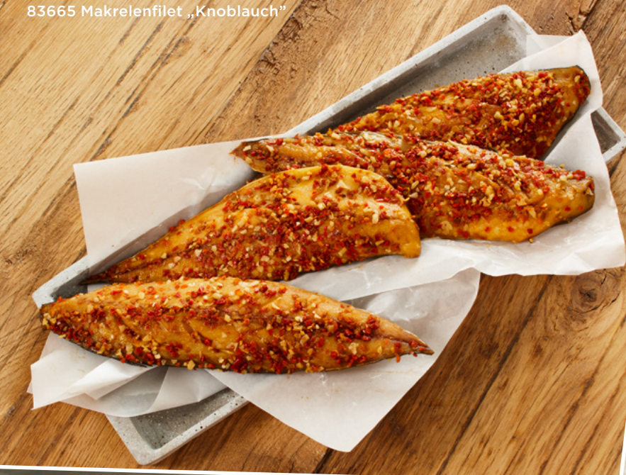
83665 Makrelenfilet „Knoblauch“