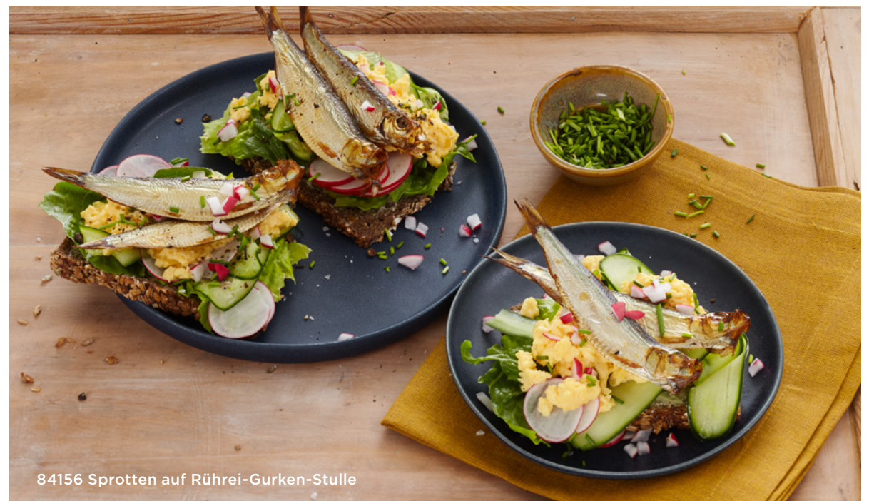
84156 Sprotten auf Rührei-Gurken-Stulle