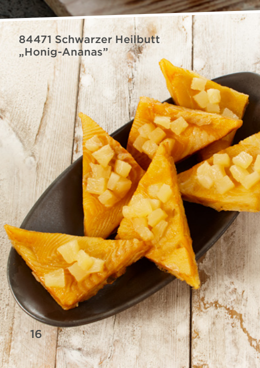
84471 Schwarzer Heilbutt „Honig-Ananas“