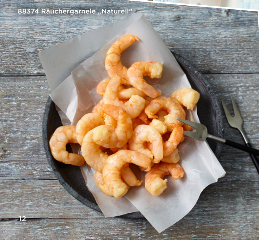
88374 Räuchergarnele „Naturell“