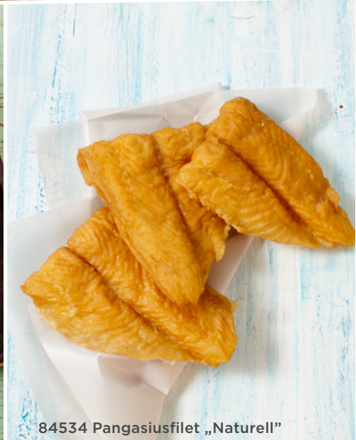
84534 Pangasiusfilet „Naturell“