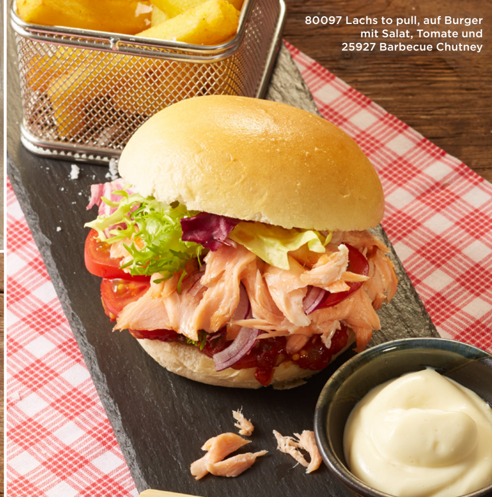
80097 Lachs to pull, auf Burger mit Salat, Tomate und 25927 Barbecue Chutney