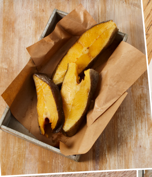
84066 Schwarzer Heilbutt-Flachschnitt