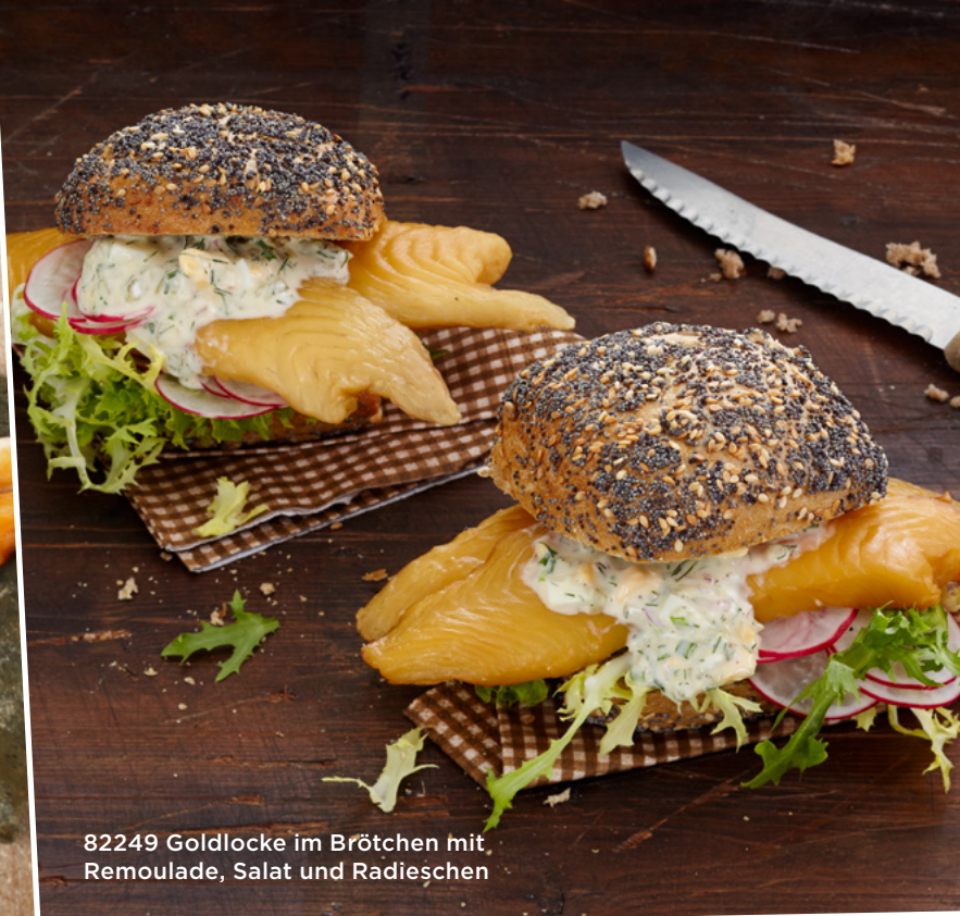
82249 Goldlocke im Brötchen mit Remoulade, Salat und Radieschen