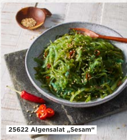
25622 Algensalat „Sesam“