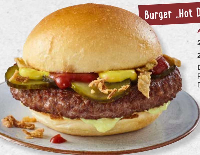
Burger „Hot Dog Style“