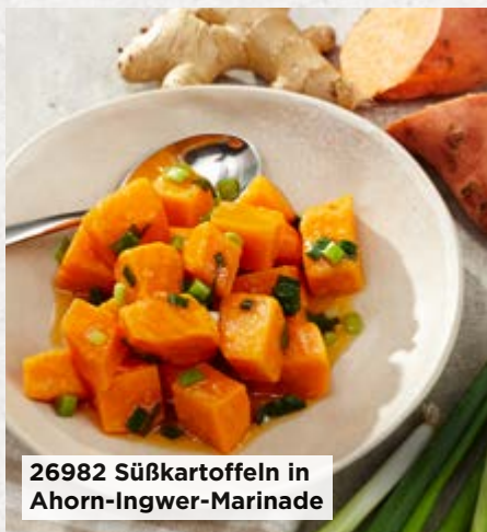
26982 Süßkartoffeln in Ahorn-Ingwer-Marinade