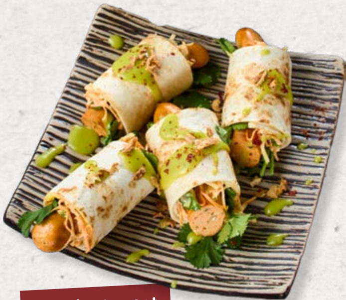
Lachsbratwurst im Tortillamantel