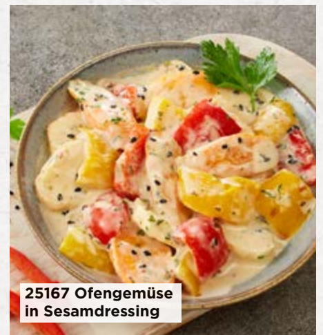
25167 Ofengemüse in Sesamdressing