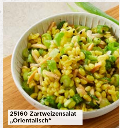
25160 Zartweizensalat „Orientalisch“