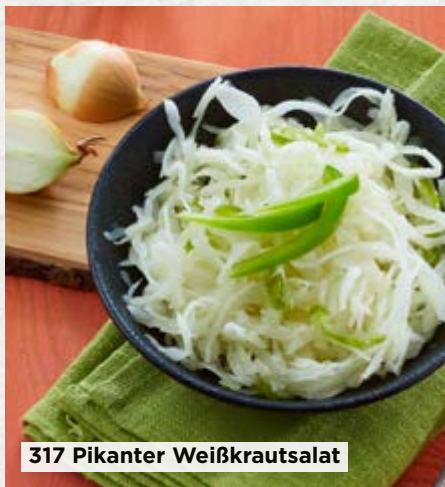
317 Pikanter Weißkrautsalat