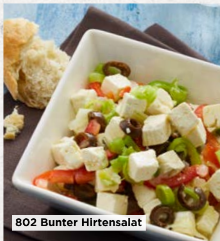
802 Bunter Hirtensalat