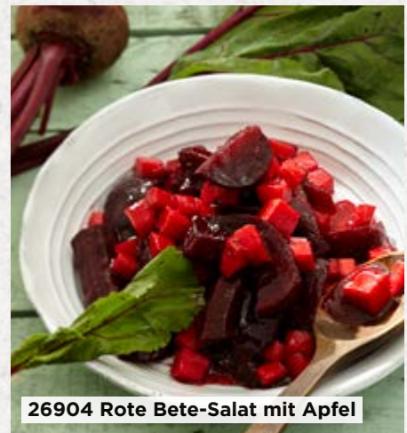
26904 Rote Bete-Salat mit Apfel