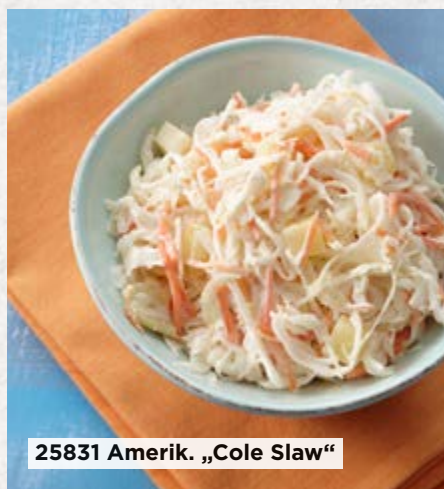
25831 Amerik. „Cole Slaw“