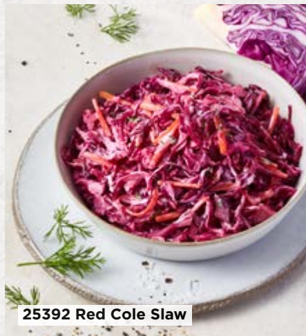
25392 Red Cole Slaw