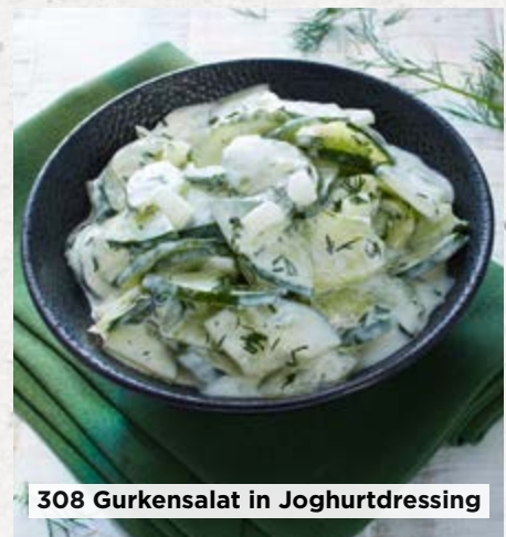
308 Gurkensalat in Joghurdressing